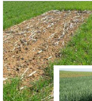
Lerchenfenster Anfang Mai