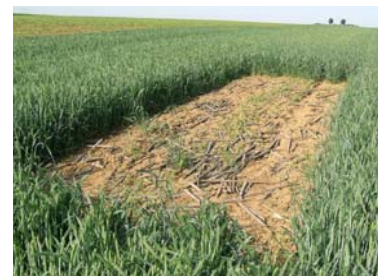
Lerchenfenster Mitte Juni